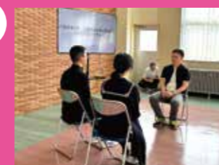
↑ 月形町の方のインタビュー動画を作成しました