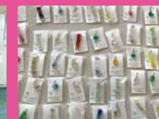
↑ 月形町のお花を使ったアクセサリを開発中です