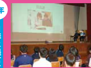
↑ 月形町へ町づくりの提言をしました