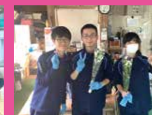
↑ 町内で農業実習を行いました