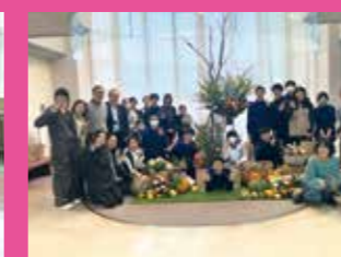
↑ 町内の花飾りのイベントに参加しました