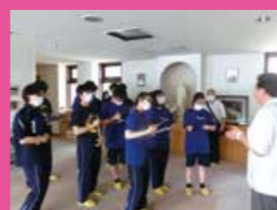
↑ 町内の施設を見学しました