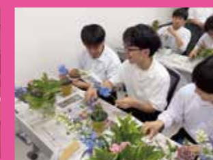
↑ 月形町のお花でフラワーアレンジ制作しました