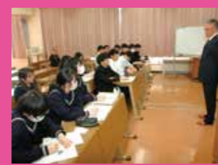
↑ 町長さんのお話を聞きました